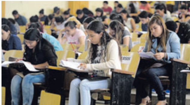
Los aspirantes de nuevo ingreso se examinaron en auditorios de varias facultades, entre ellas Derecho.

Las autoridades de la UES esperaban que 24 mil 459 personas que se habían inscrito se sometieran a la evaluación, que comenzó a eso de las 8:10 a.m. Según las indicaciones, los alumnos tuvieron dos horas para completar la prueba, y los que no pasen tendrán otra oportunidad.